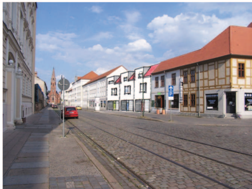
Blick in die Ferdinand- von- Schill- Straße